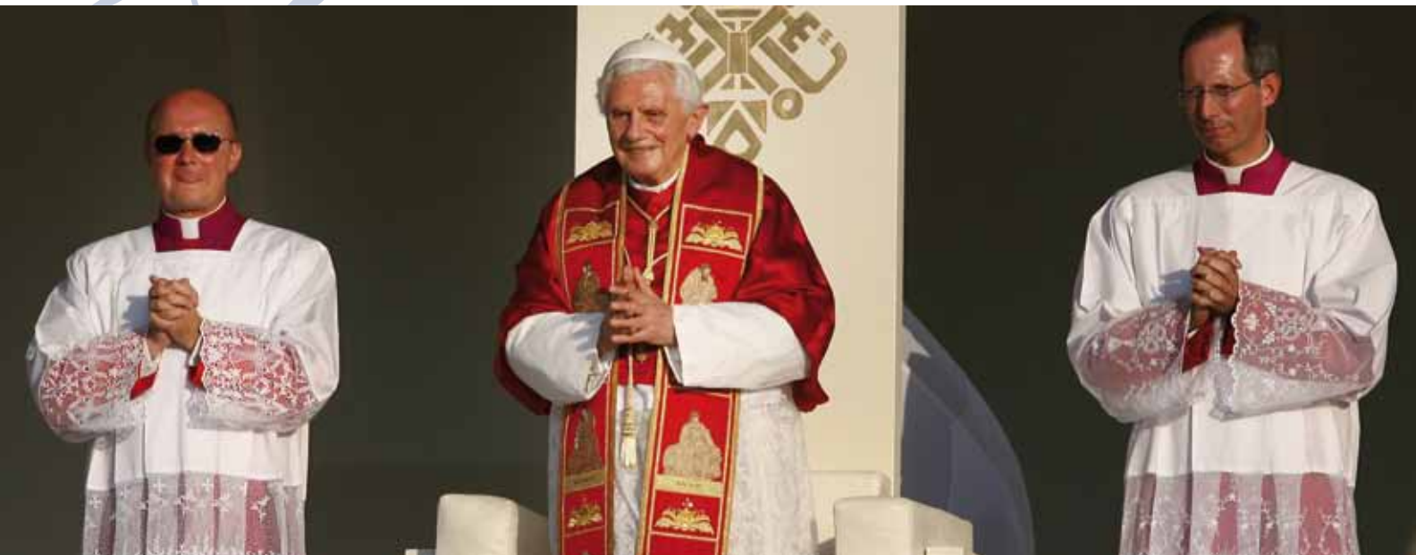
Benedictus XVI tijdens de Wereldjongerendagen 2011 in Madrid.

Priester- en Diakenopleiding Bovendonk, Hofstraat 8, 4741 AK Hoeven